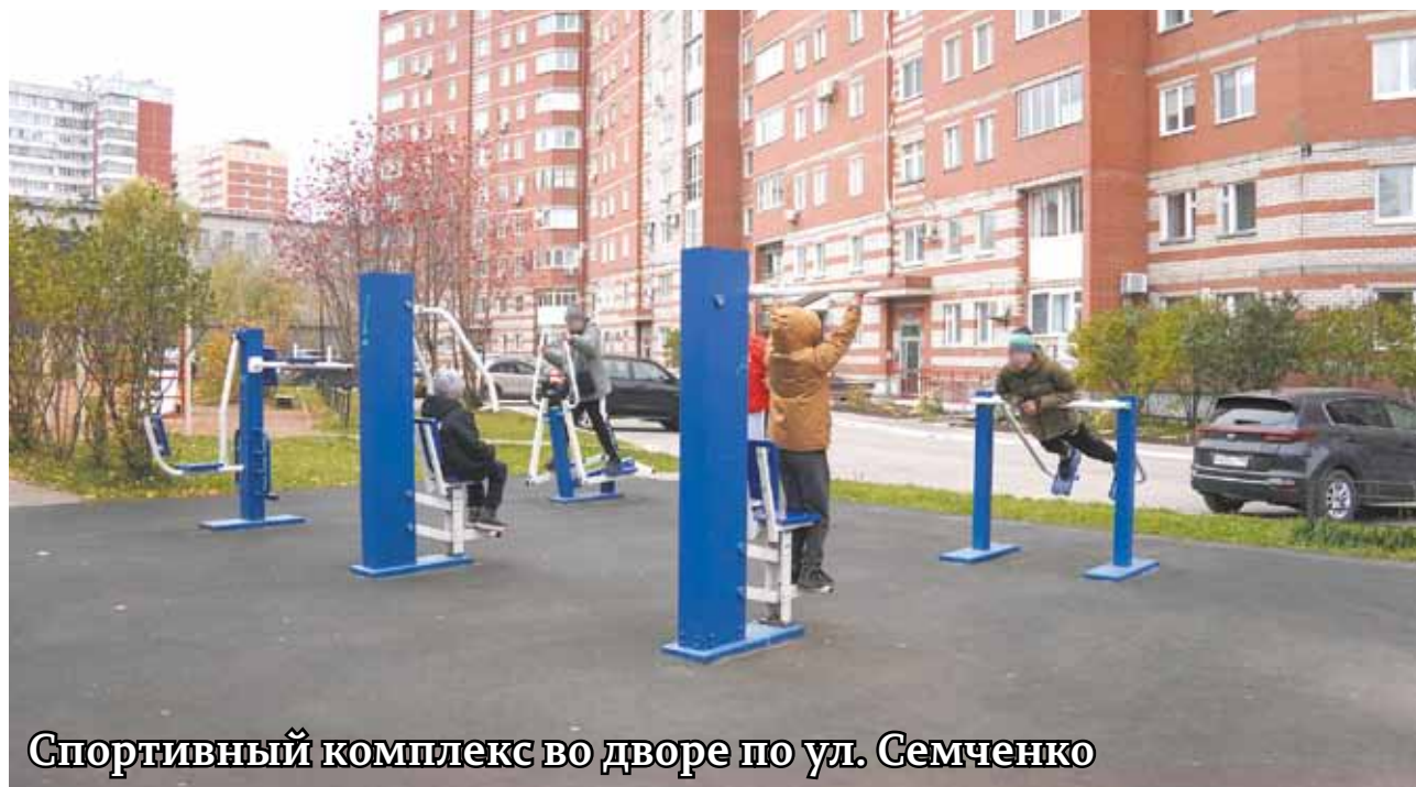
Спортивный комплекс во дворе по ул. Семченко