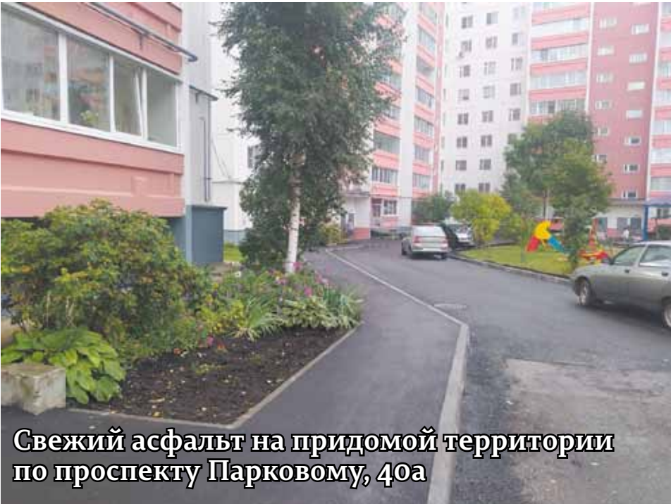
Свежий асфальт на придомой территории по проспекту Парковому, 40а