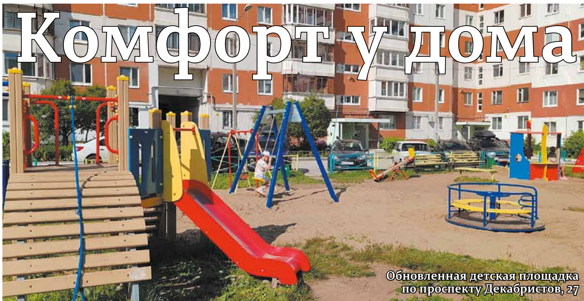
Обновленная детская площадка по проспекту Декабристов, 27

В Перми подводят итоги благоустройства придомовых территорий. Это важная часть комфортной городской среды, которой традиционно уделяется особое внимание. Депутаты Пермской городской Думы вместе с жителями контролируют качество проведенных работ. В этом строительном сезоне обновлено порядка 100 дворов.