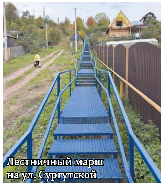
Лестничный марш на ул. Сургутской