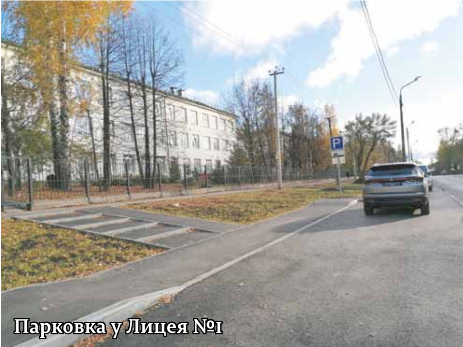
Парковка у Лицея №1