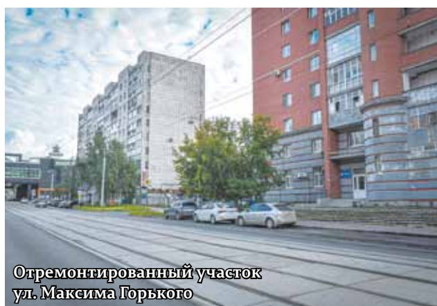
Отремонтированный участок ул. Максима Горького