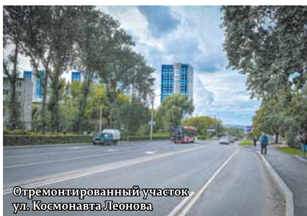
Отремонтированный участок ул. Космонавта Леонова