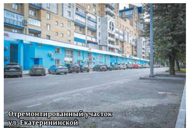
Отремонтированный участок ул. Екатерининской

*Работы выполнены в 2024 году.