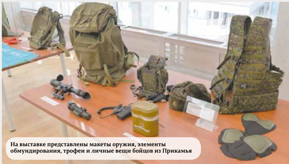
На выставке представлены макеты оружия, элементы обмундирования, трофеи и личные вещи бойцов из Прикамья

Многие экспонаты сопровождаются историями, которые передали родственники и сослуживцы военнослужащих. Среди них – мобильный телефон, пробитый осколком гранаты, простреленная каска и дрон, который использовался для доставки лекарственных средств и провизии на переднюю линию обороны. Им управляли бойцы, поддерживающие наступление на Покровск.