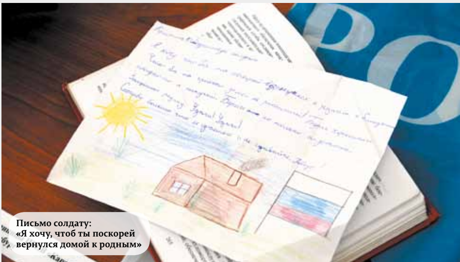
Письмо солдату: «Я хочу, чтоб ты поскорей вернулся домой к родным»