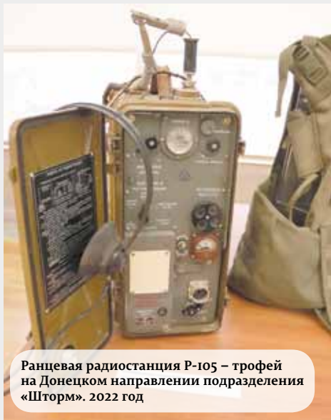
Ранцевая радиостанция Р-105 – трофей на Донцком направлении подразделения «Штурм». 2022 год

Вторая экспозиция – выставка «За жизнь!» Законодательного Собрания Пермского края, посвященная участникам специальной военной операции. На ней представлены макеты оружия, элементы обмундирования, знаки различия, трофеи. Часть выставки составили личные вещи бойцов из Прикамья, в том числе экс-депутата краевого парламента и