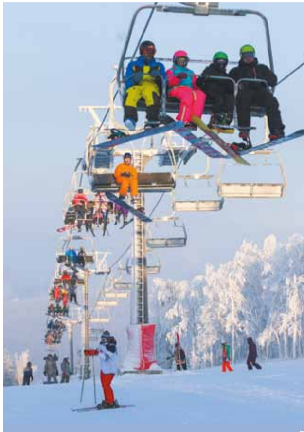
В прошлом году ВК «Губаха» был признан самым выгодным российским курортом по версии «Ski Business Award-2021», а годом ранее он получил награду в номинации «Лучший горнолыжный курорт по обучению катанию».