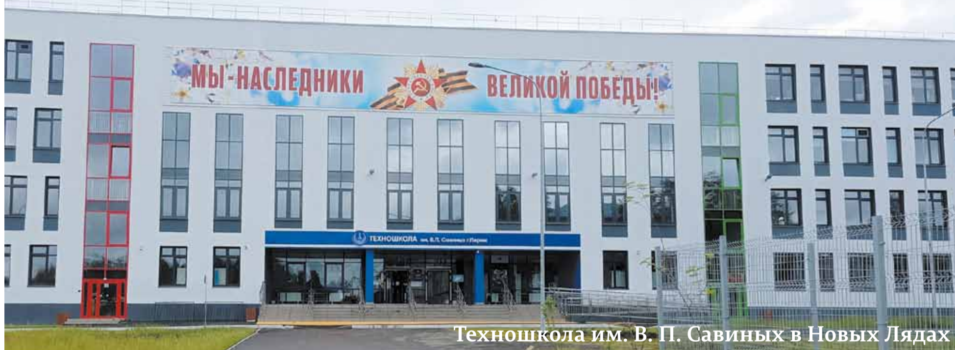
Техношкола им. В. П. Савиных в Новых Лядах

На заседании Пермской городской Думы депутаты присвоили звания Почетных граждан ветеранам Великой Отечественной войны. Решение принято к юбилею Победы. Также народные избранники оценили работу аудиторов Контрольно-счетной палаты и уровень преступности в городе.