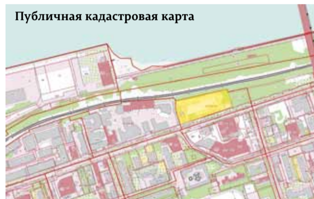
Публичная кадастровая карта

Резервирования и изъятия земельных участков для государственных нужд не потребуются. Однако предполагается установление публичных сервитутов для обеспечения строительства, реконструкции объектов инфраструктуры в отношении двух участков. Один относится к дорожной сети и включает отрезок улицы Окулова от ул. Монастырской до ул. Попова. Второй находится по ул. Окулова, 14 – здесь на площадке бывшего ДК «Телта» строится гостиничный комплекс с апартаментами.