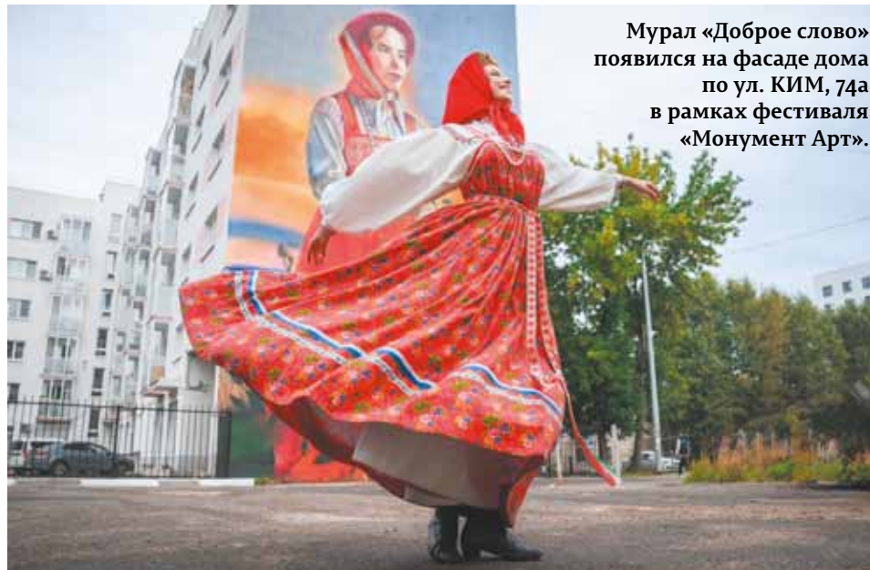
Мурал «Доброе слово» появился на фасаде дома по ул. КИМ, 74а в рамках фестиваля «Монумент Арт».