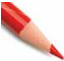
«Деловая газета «Business Class» Пермский край»

Учредитель – ООО «Центр деловой информации», 614015, г. Пермь, ул. Петропавловская, 59А, 4-й этаж, офис 6. Тел. +7 (922) 371-30-28. Главный редактор В. Е. Владимиров