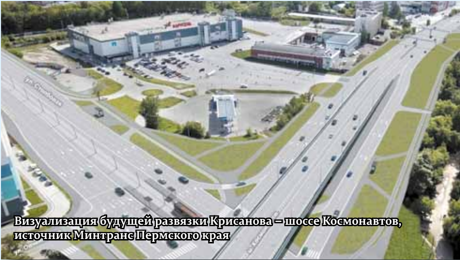
Визуализация будущей развязки Крисанова – шоссе Космонавтов

Обеспечить проезд по основным городским магистралям большого количества транспорта при относительно неширокой проезжей части позволяет приоритет с точки зрения светофорного регулирования. Например, на шоссе Космонавтов «зеленый» горит существенно дольше, чем на пересекающих его второстепенных улицах. Аналогично обеспечивается пропускная способность, скажем, улицы Героев Хасана.