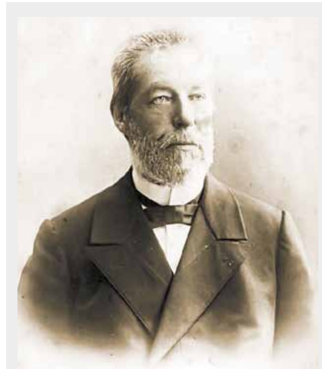
Основатель Березниковского содового завода Иван Иванович ЛЮБИМОВ

Предприятие продолжает реализацию инвестиционной программы. В 2023 году в нее включено 43 проекта. В числе наиболее значимых – замена колонного оборудования и завершение монтажа межплощадочного паропровода от ТЭЦ до производственной площадки АО «БСЗ». Также в планах – мероприятия по техническому перевооружению и поддержанию основных фондов предприятия.