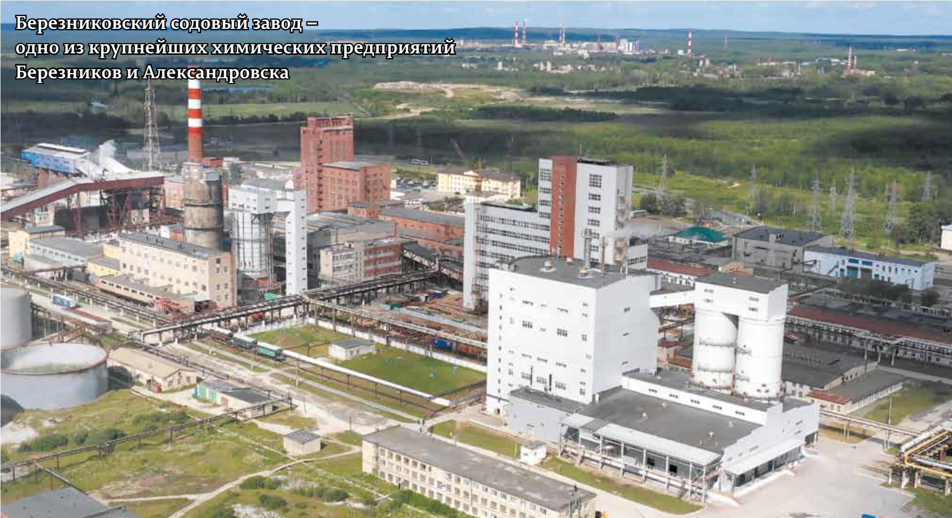
Березниковский содовый завод – одно из крупнейших химических предприятий Березников и Александровска