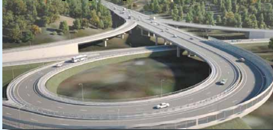
Визуализация трассы ТР-53, источник Минтранс Пермского края