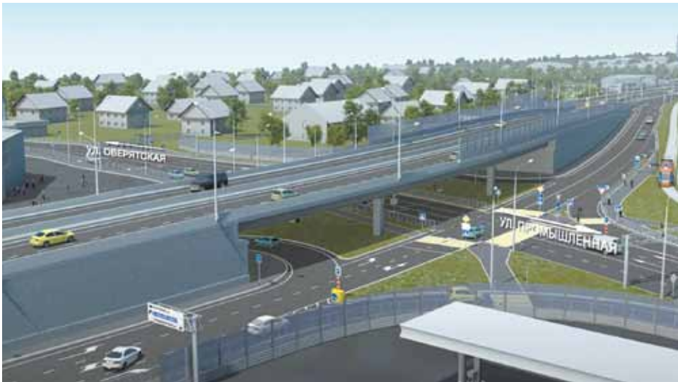
Изображение: институт Гипростроймост (Москва)

Мост через Мулянку, по замыслу авторов, состоит из трех независимо стоящих сооружений: в центре