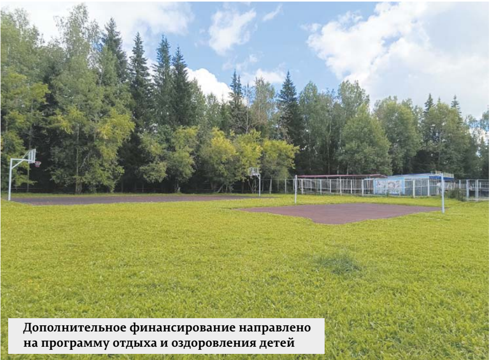
Дополнительное финансирование направлено на программу отдыха и оздоровления детей

В ходе заседания депутаты городской Думы приняли решение о продлении действия некоторых ключевых мер социальной поддержки. В их числе – пере-