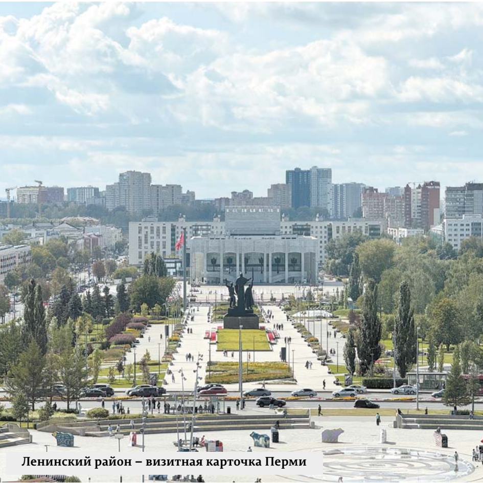
Ленинский район – визитная карточка Перми

Регулярно проводятся мероприятия, направленные на популяризацию здорового образа жизни и привлечение граждан к регулярным занятиям спортом. На территории района организована спортивно-массовая работа под руководством тренера: общая физическая подготовка, северная ходьба, футбол, волейбол, настольный теннис.