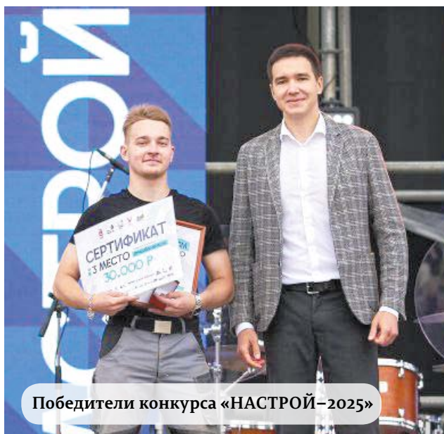
Победители конкурса «НАСТРОЙ–2025»

– Да, конечно, ожидаем. Но, думаю, оживление рынка станет заметно, когда ставки по ипотеке опустятся до 10-12 процентов годовых. Вот тогда она будет уже достаточно востребована. Прогнозируем, что в лучшем случае это может произойти к середине следующего года.