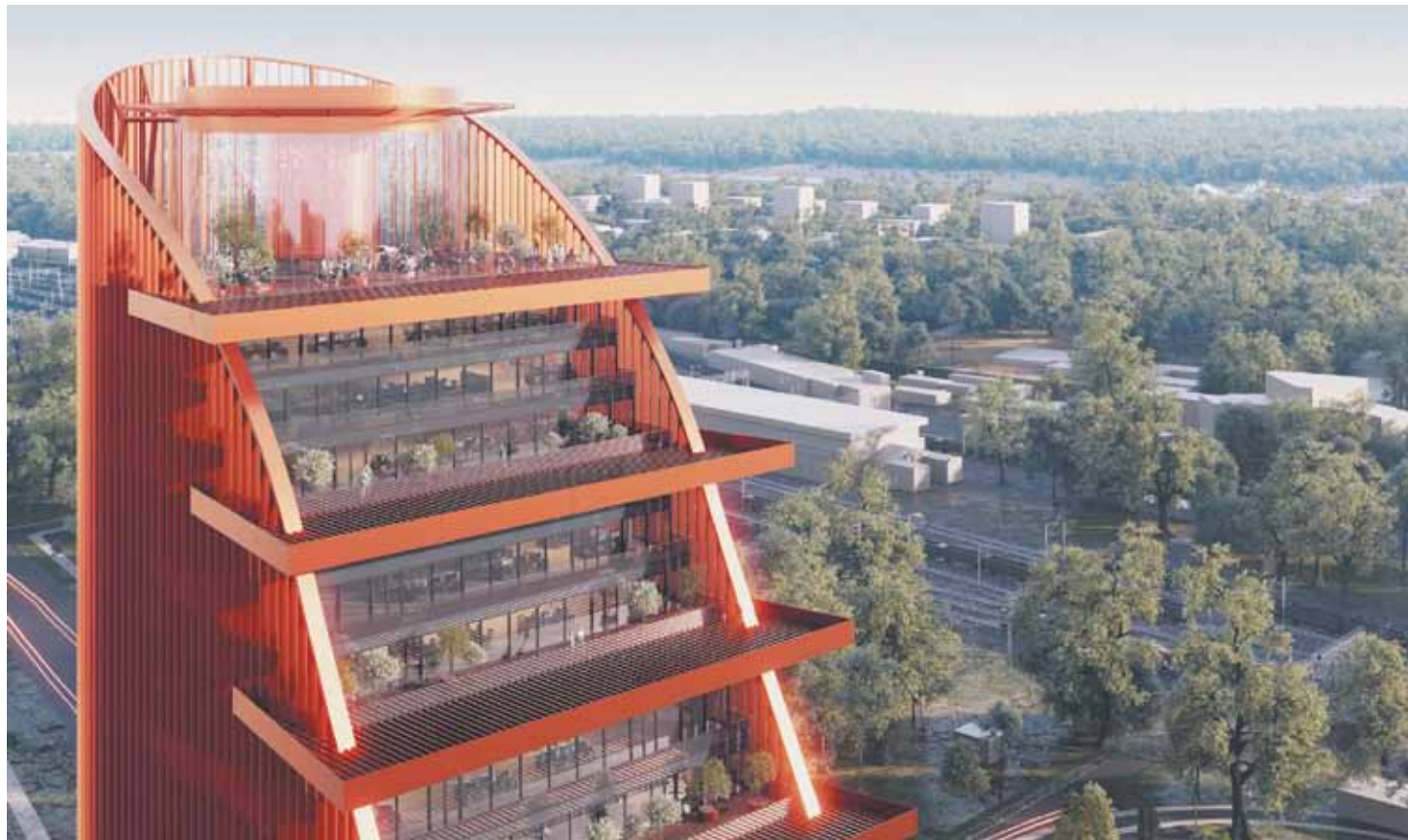
Визуализация проекта Пермь-Сити

– По-прежнему планируем построить в микрорайоне здание в виде локомотива, но оно будет жилым. Мы приняли решение сделать застройку разнообразной, отказались от моноархитектурного стиля. Наоборот, в микрорайоне ДКЖ разместятся четыре разных архитектурных ансамбля наравне с акцентным комплексом «Пермь-Сити». К примеру, около же-