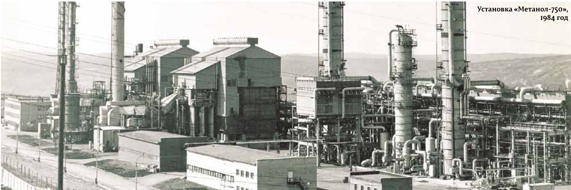
Установка «Метанол-750», 1984 год

бинеты, своя библиотека. Плюс рядом прекрасный стадион, тут же сам корпус колледжа, мастерские, то есть развитие идет по пути формирования кампуса и создания комфортной среды.