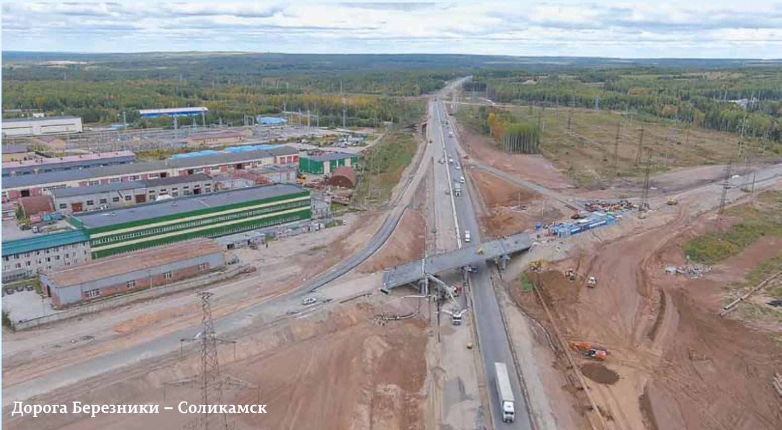
Дорога Березники – Соликамск

Сегодня объект воссоздается как единая трехмерная информационная модель, которая содержит в себе все данные о каждой детали строительства.