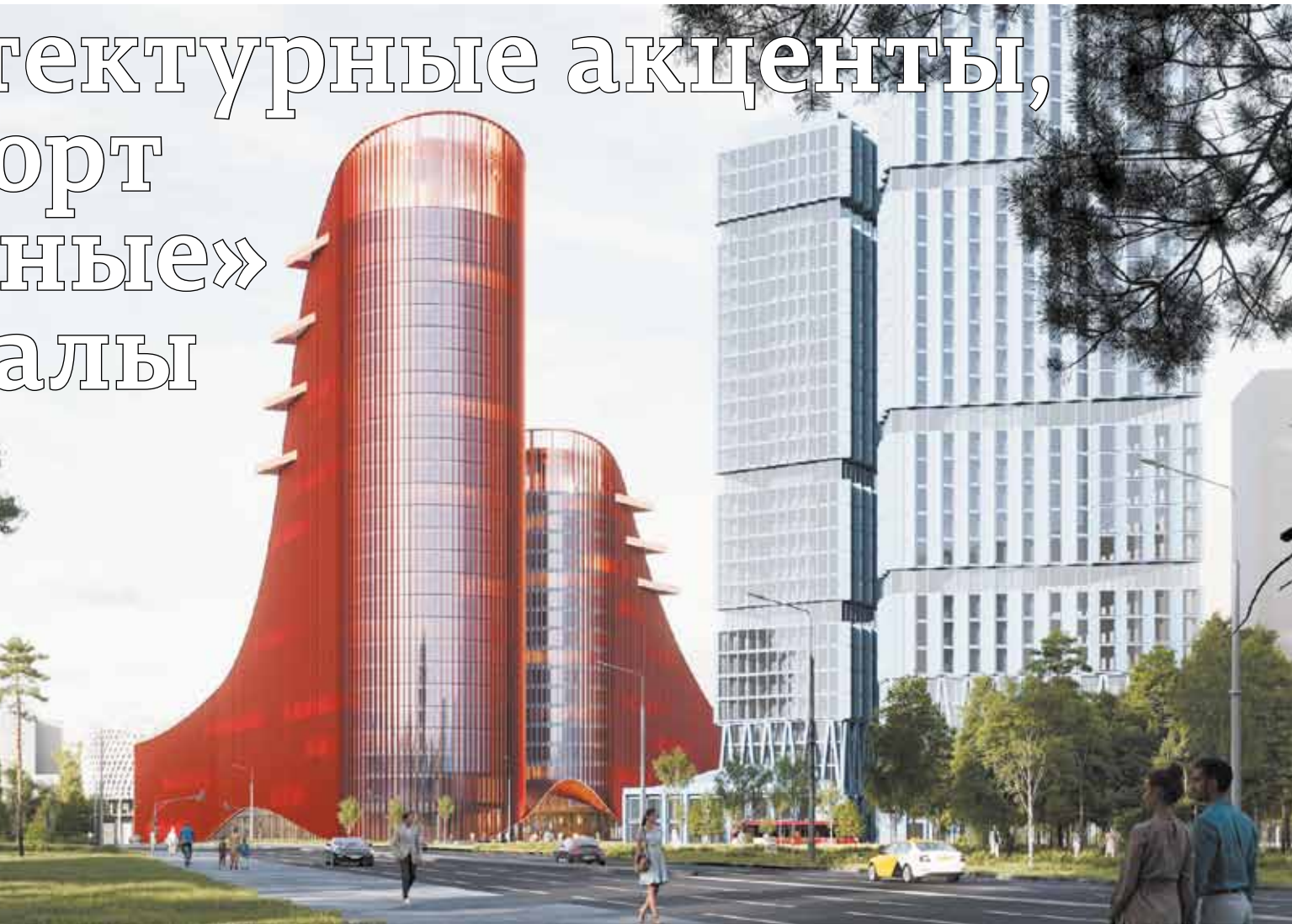
Визуализация проекта Пермь-Сити