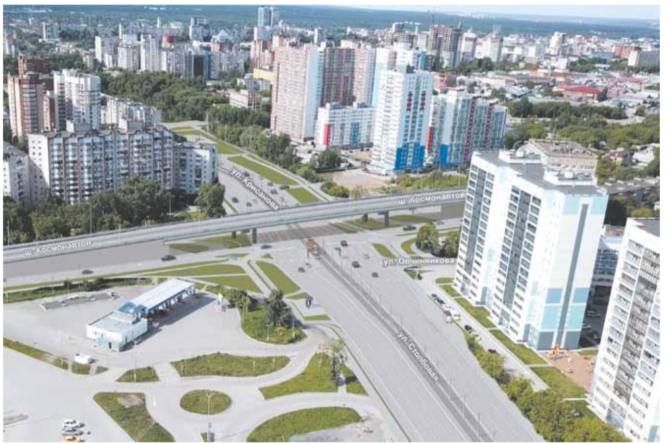
Проект развязки шоссе Космонавтов с ул. Крисанова и Столбовой (Карпинского).