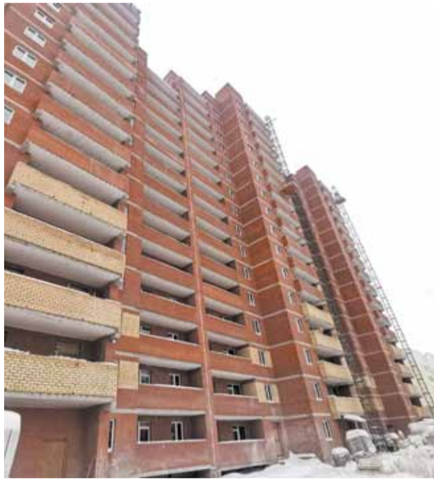
Дом по ул. Сокольская 10б.

На восьми из 11 долгостроев ведутся строительномонтажные работы с применением механизмов федерального Фонда развития территорий. Это три дома в Индустриальном районе (ЖК «Триумф. Вторая очередь»), три – в Дзержинском (ЖК «Весна» на Парковом) и по одному в Кировском (по ул. Сокольской, 10б) и Свердловском (ЖК «Авиатор»). При помощи региональных мер уже достроены два объекта – по ул. Теплогорской, 20 и 22. Ввод их запланирован в этом году. На отдельном контроле краевых властей из-за срыва строительства подрядчиком стоит ЖК «Столичный» по ул. Декабристов, 97.