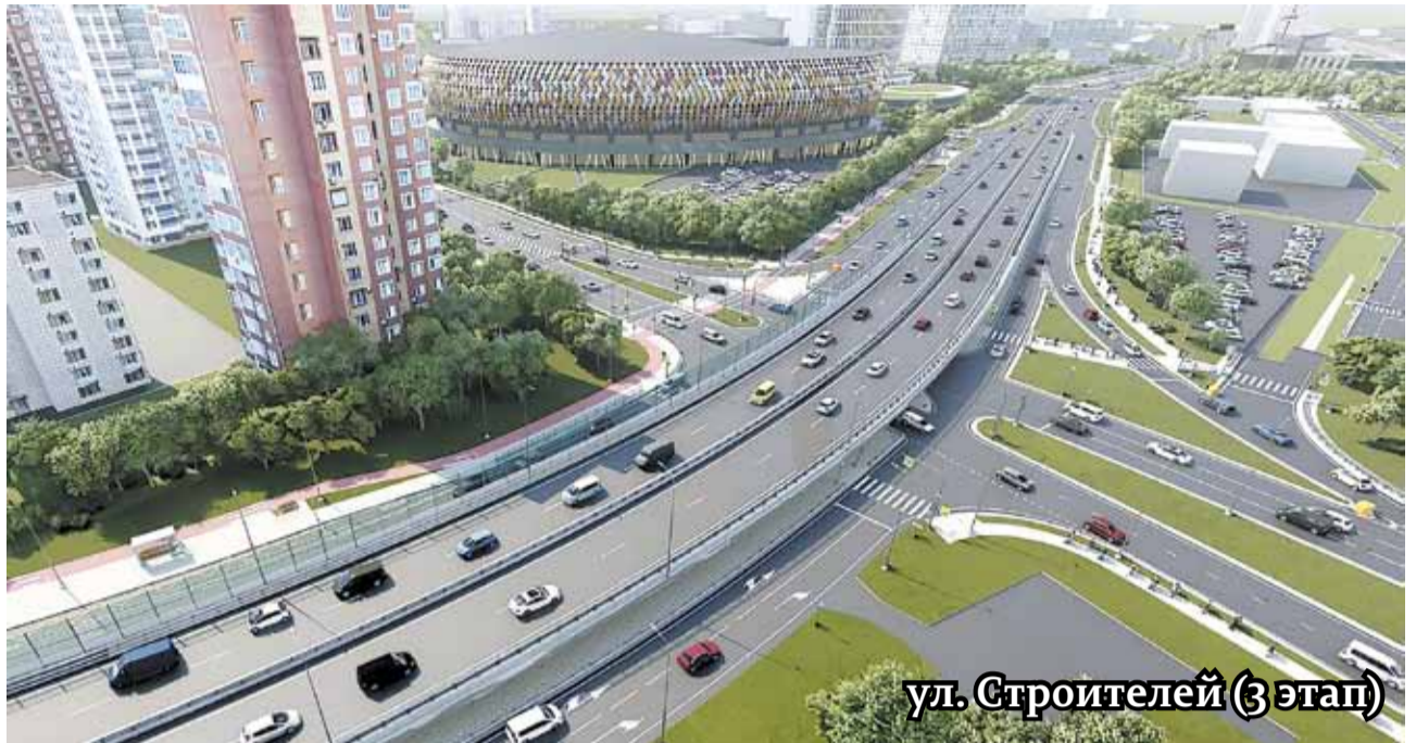
ул. Строителей (3 этап)

Сдача первого этапа намечена на конец 2024 года. Параллельно реализуется второй этап, предпо-