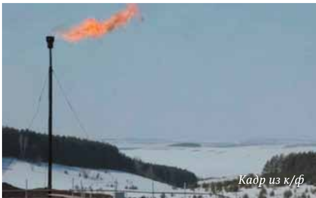
Кадр из к/ф

В театре юного зрителя 6 октября стартовал XIII Международный кинофестиваль «Флаэртиана». Документальный смотр этого года рискует стать самым «международным» за всю историю фестиваля.