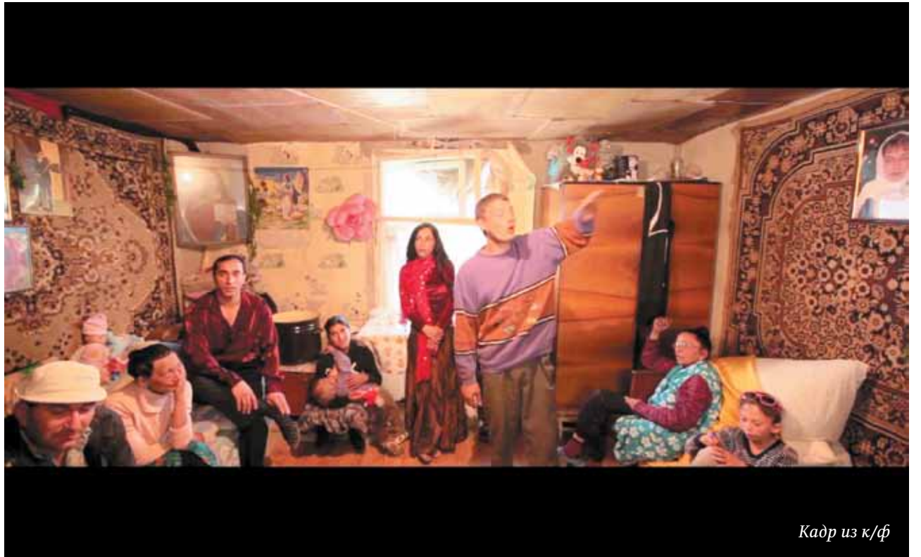
Кадр из к/ф

За главный приз – «Золотого Нанука» – в этом году будут бороться 15 фильмов из Великобритании, США, Голландии, Испании, Дании, Германии, Польши, Финляндии и других европейских стран. В международный конкурс также попал российский фильм режиссера Насти Тарасовой «Линар». Большая часть картин будет показана в России впервые, многие из которых представят сами режиссеры. Мировые премьеры состоятся в рамках российской