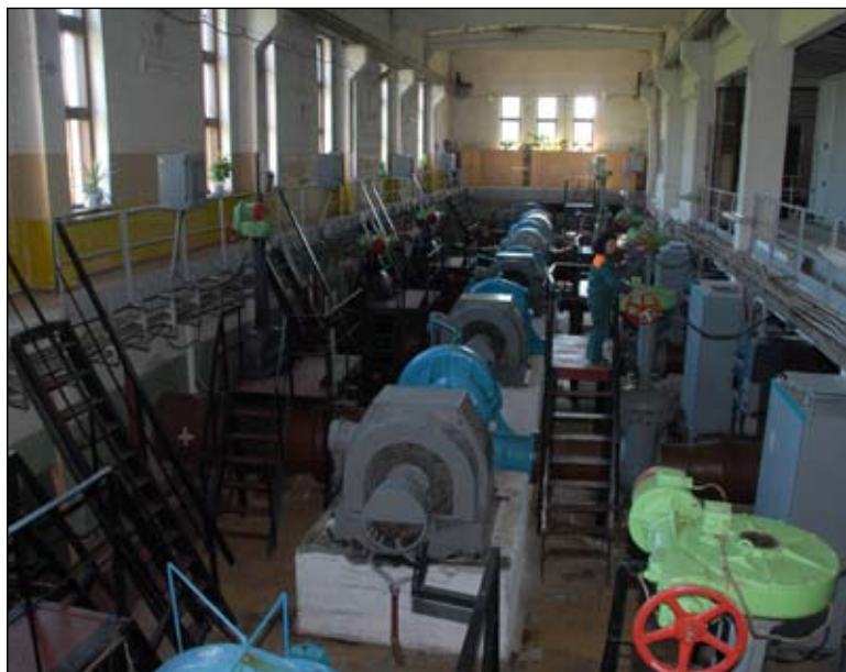
Если бы реконструкция очистных сооружений была застрахована, то потери несла бы страховая компания, а не бюджет

Недоступная информация. Сами игроки рынка отмечают, что главным препятствием