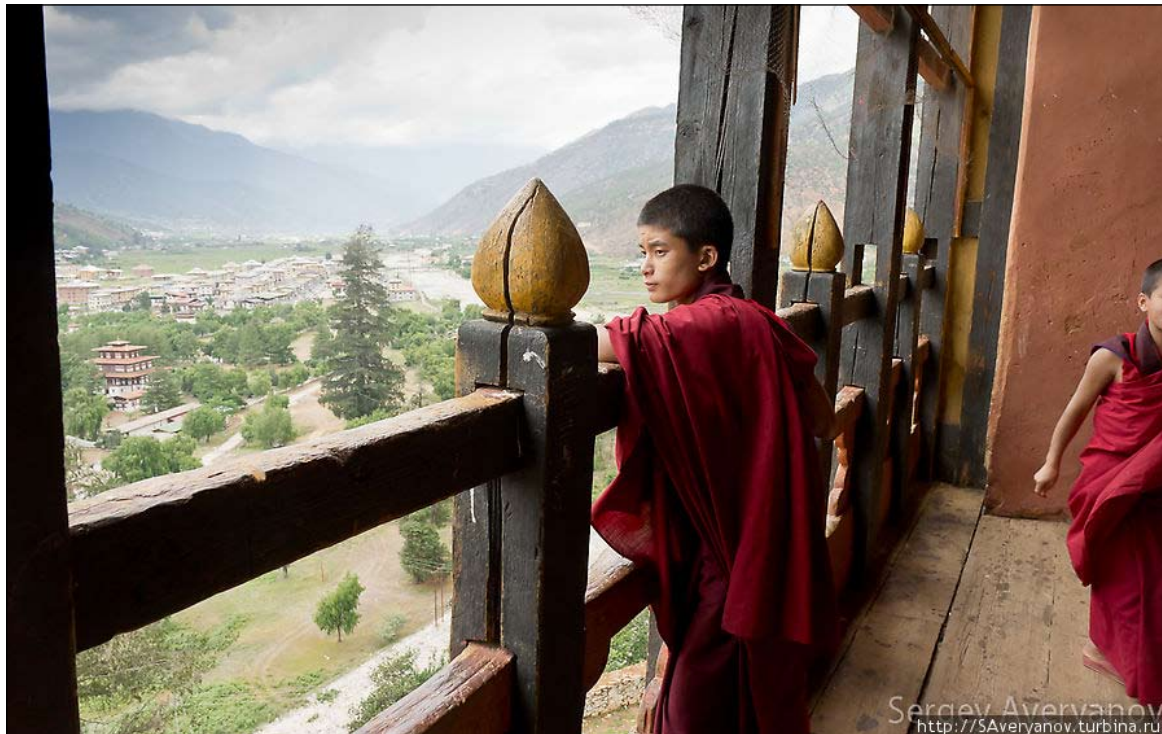
В бутанских монастырях учат созерцанию

Вообще история Бутана довольно загадочна, а все события ранее 1827 года, когда сгорела библиотека в городе Пунахе, во-