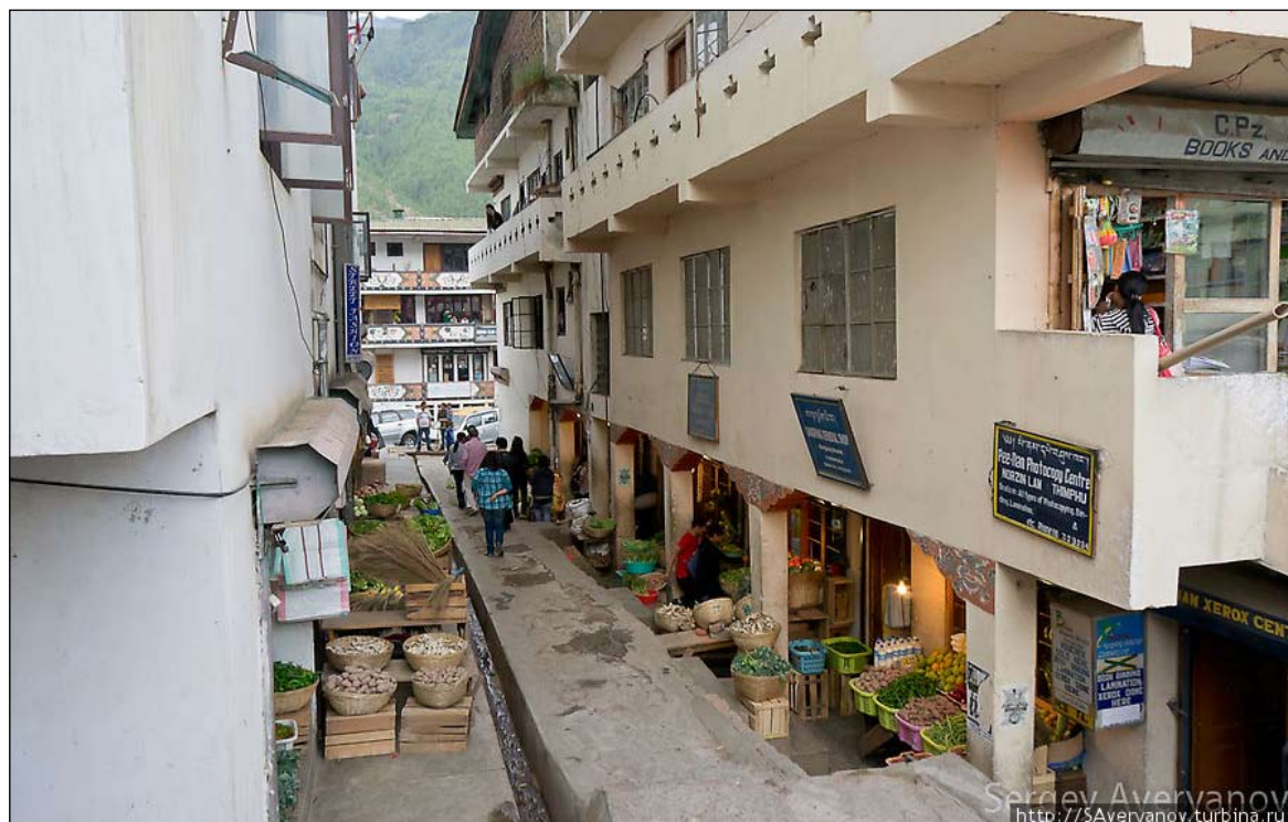
Узкие столичные улочки отличаются опрятностью

Авторские путешествия по всему миру — клуб «Геоцельс». http://www.geocels.ru/