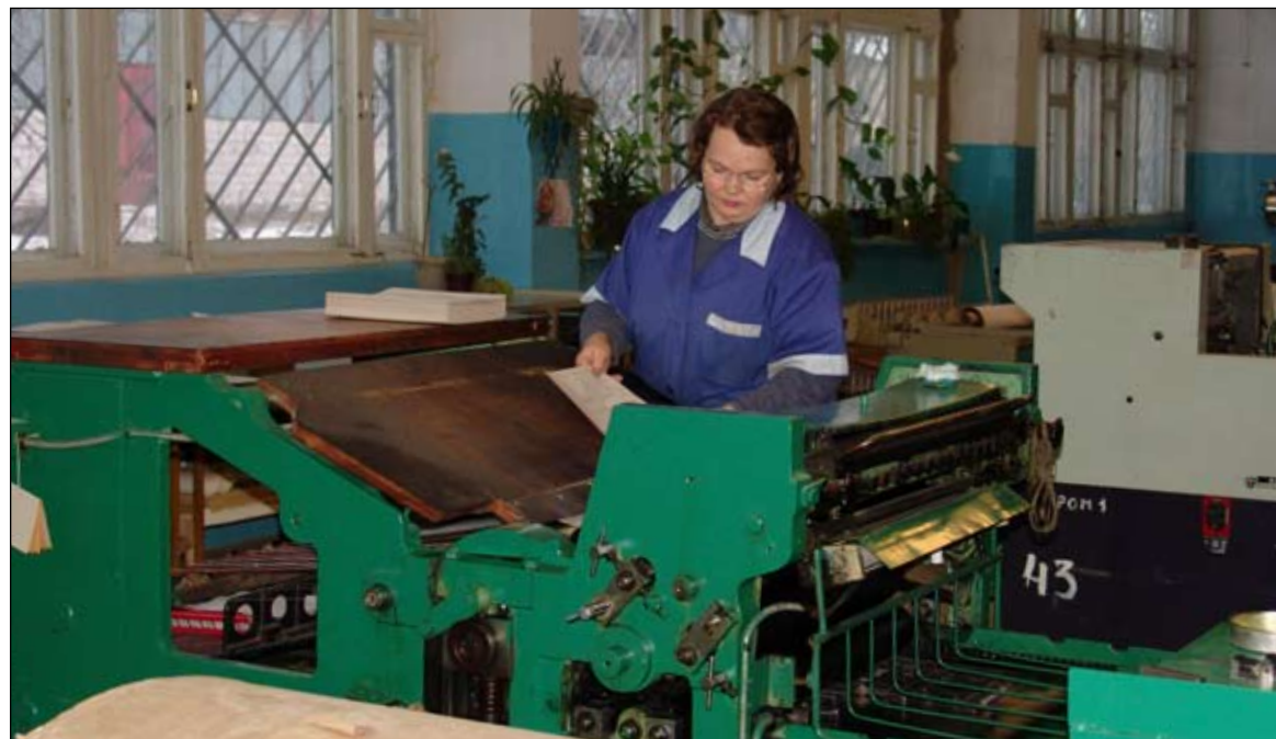
Коллеги по бизнесу сетуют, что здесь много не заработаешь

Краснокамская полиграфическая компания выставлена на продажу за 50 млн рублей. Эксперты разошлись в оценках рентабельности этого бизнеса.