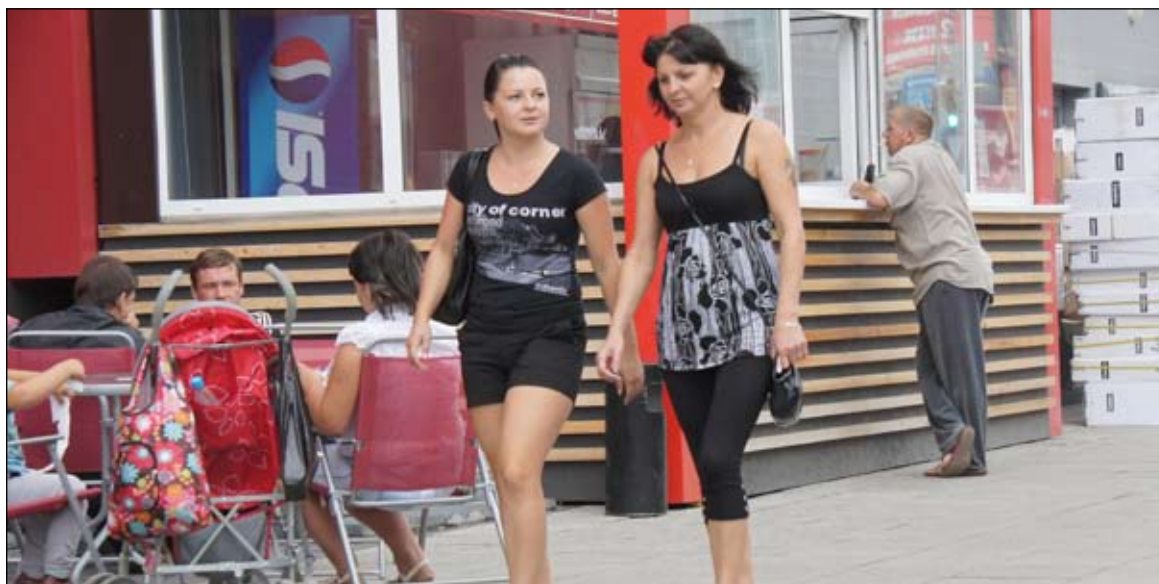
В администрациях и судах хотят, чтобы «пляжные одежды» оставались на улице