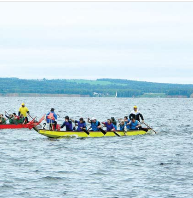
Губернатор и главы муниципалитетов поплывут в одной лодке

одке» и расставляет приоритеты муниципальной политики. Куда поплывет эта лодка, станет ясно после