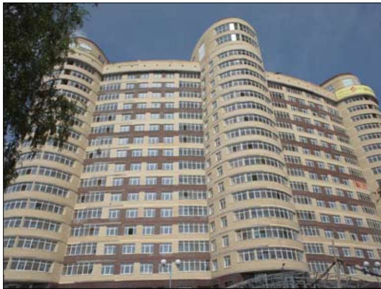
Проверяющие разглядели трещины

Наибольшие споры в суде вызвали выявленные трещины.