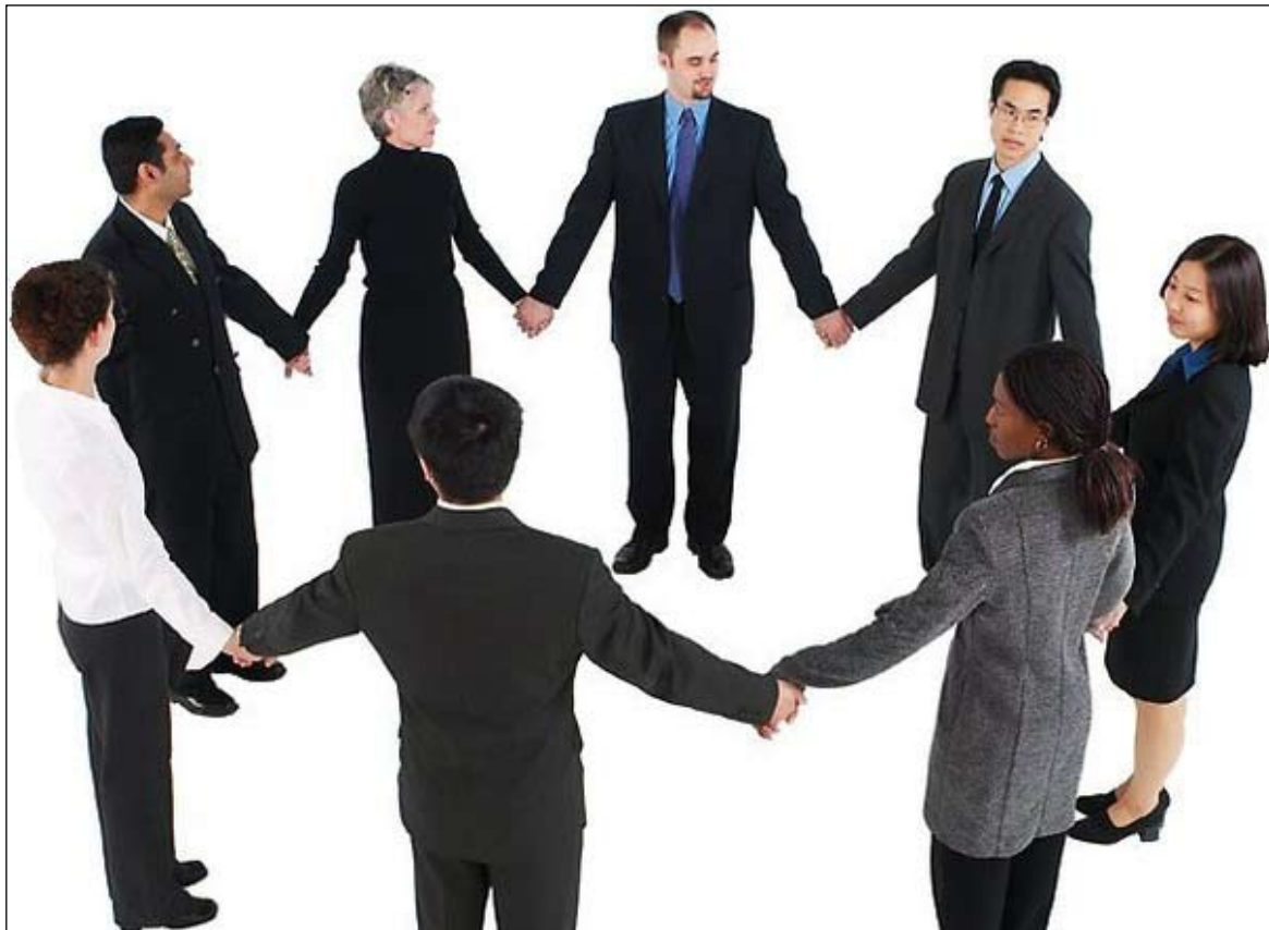
За чужим окружением можно и себя потерять

Администрация губернатора играет в свою игру. Первые последствия этого Виктор Басаргин может почувствовать уже в начале осени.