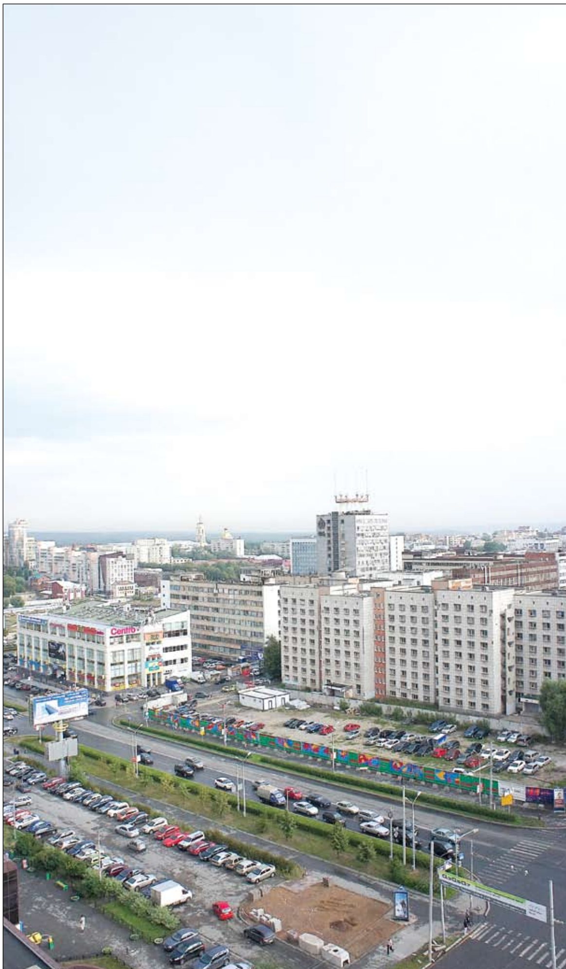
Пустоту рядом с «Айсбергом» заполнят не раньше 2014 года