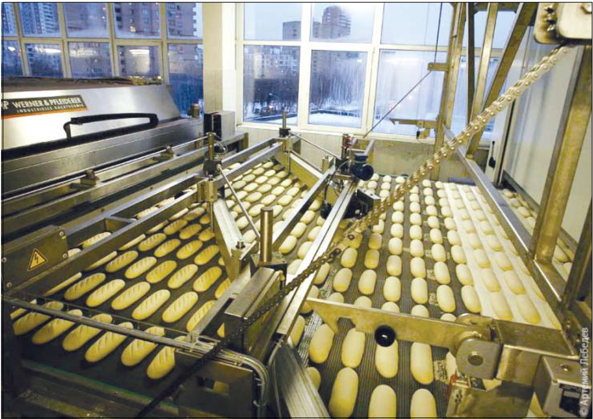
Производители хлеба все же «порадуют» пермяков повышением цен

Аналитики обсуждают возможный рост стоимости продуктов питания. Пермские производители тоже заговорили о повышении цен.