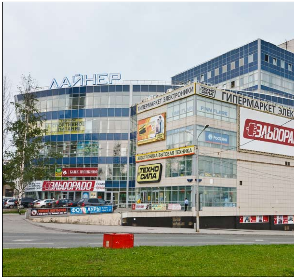
Помещение в «Лайнере» так и не заинтересовало покупателей

ФАУГИ и Райффайзенбанк творят историю в зале арбитражного суда. Прецедентов таких исков еще не было.