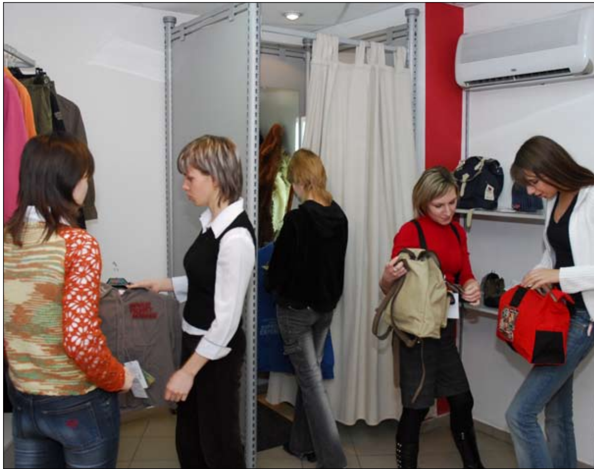
При покупке через Интернет вещь нельзя ни потрогать, ни примерить