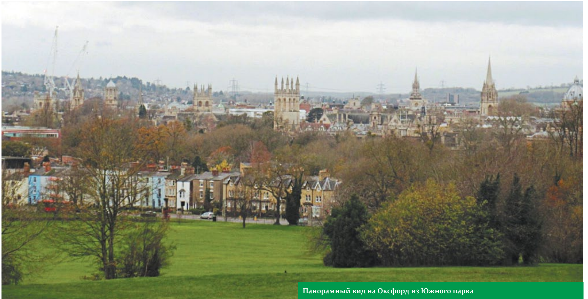
Панорамный вид на Оксфорд из Южного парка

Недвижимость в Оксфорде дороже, чем в Лондоне. Однако, в городе-побратиме Перми стремятся жить, несмотря на массу дополнительных нюансов.