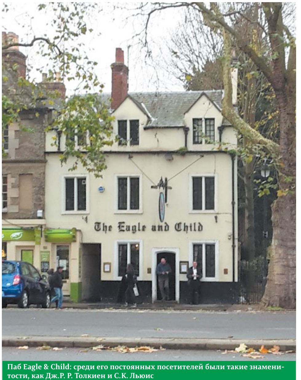
Паб Eagle & Child: среди его постоянных посетителей были такие знаменитости, как Дж.Р. Р. Толкиен и С.К. Льюис

Тем не менее, надо учиться уживаться с этими странностями города. В конце концов именно они и составляют его очарование. Вы не можете сказать, что на самом деле были в Оксфорде, если не побывали внутри множества традиций и красивых зданий, наполняющих центр города, и не почувствовали дух Оксфорда в полном его объеме. Достоинства города в разы перевешивают его недостатки, и взглянуть нужно на все стороны многоликого Оксфорда. Единственное, что проблематично сейчас сделать, – это обосноваться и пустить здесь корни. Есть ли вероятность, что этот пузырь на рынке недвижимости когда-нибудь лопнет?