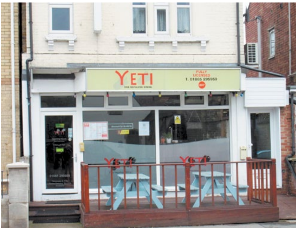
Ресторан непальской кухни Yeti в районе Коули